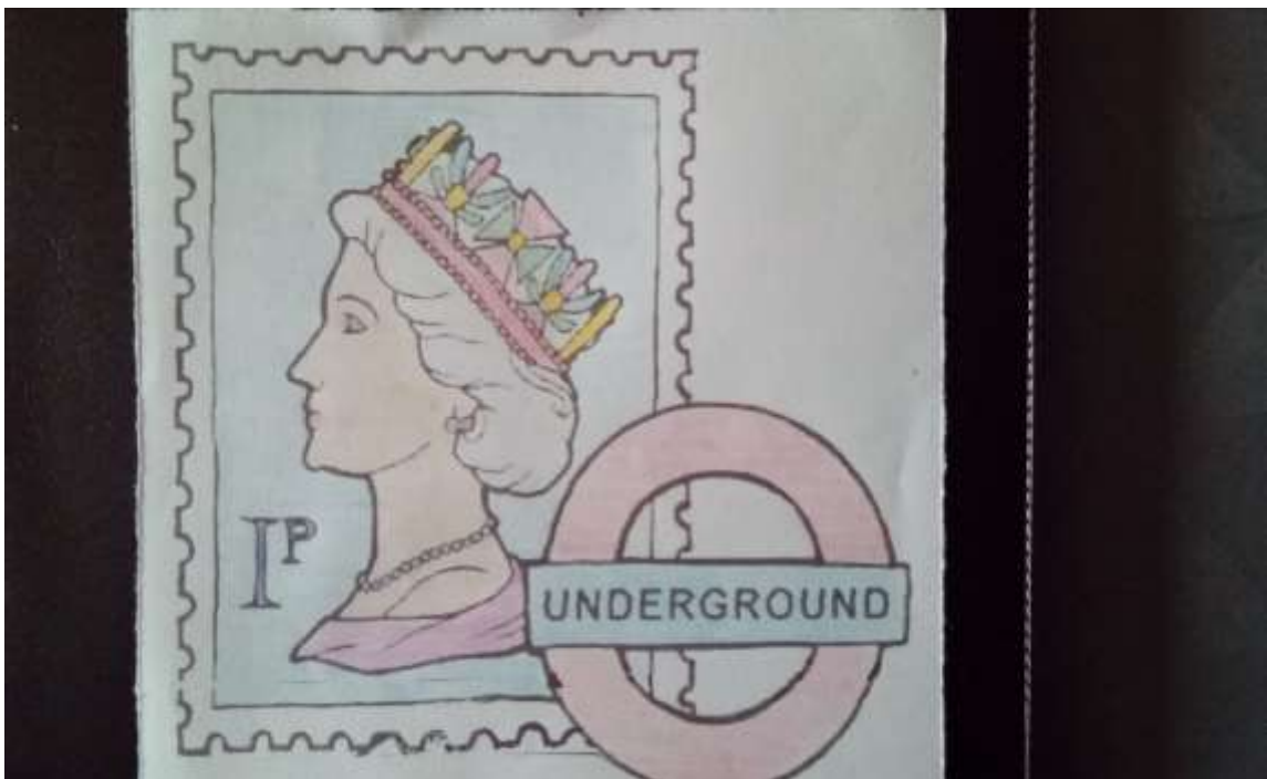
Un portrait de la Reine Elisabeth II réalisé par Elsa Tahon, de l'atelier philatélique jeunesse, en octobre 2022

Les stocks de billets existants, où figure toujours Elizabeth II, seront mis en circulation comme prévu, tandis que la nouvelle monnaie en polymère - qui a remplacé progressivement la monnaie papier au Royaume-Uni depuis 2016 - ne sera imprimée que pour prendre la place « des billets usés et pour répondre à toute augmentation globale de la demande ».