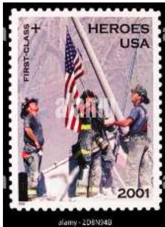
USA : hommage aux héros du 11 septembre