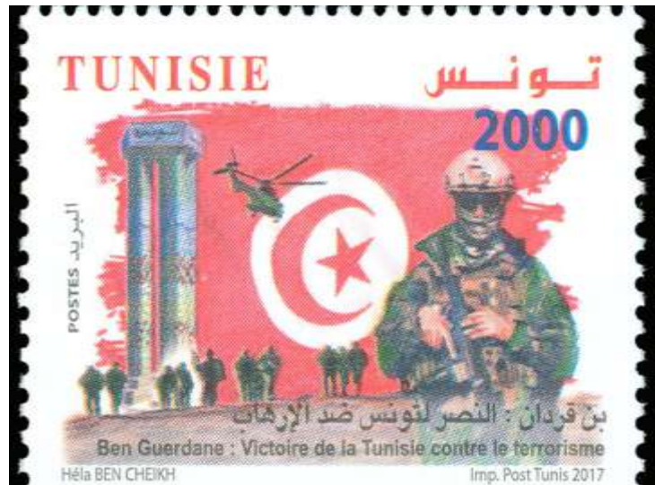
Tunisie : lutte antiterroriste