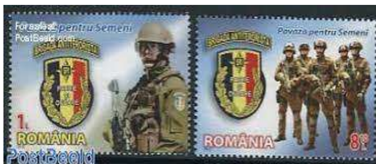
Roumanie :timbre célébrant les forces antiterroristes

La France est le pays européen le plus touché par des attaques commanditées ou inspirées par l'État islamique , qui, depuis 2015, ont causé près de 300 morts, attaques auxquelles s'ajoutent, les attentats échoués ou déjoués. Alors que dans le reste de l'Europe, les terroristes cherchant à tuer indistinctement le plus grand nombre de personnes par exemple avec des véhicules-béliers, les actes commis en France ont aussi la particularité de cibler (dans neuf cas sur onze en 2017) des membres des forces de l'ordre.