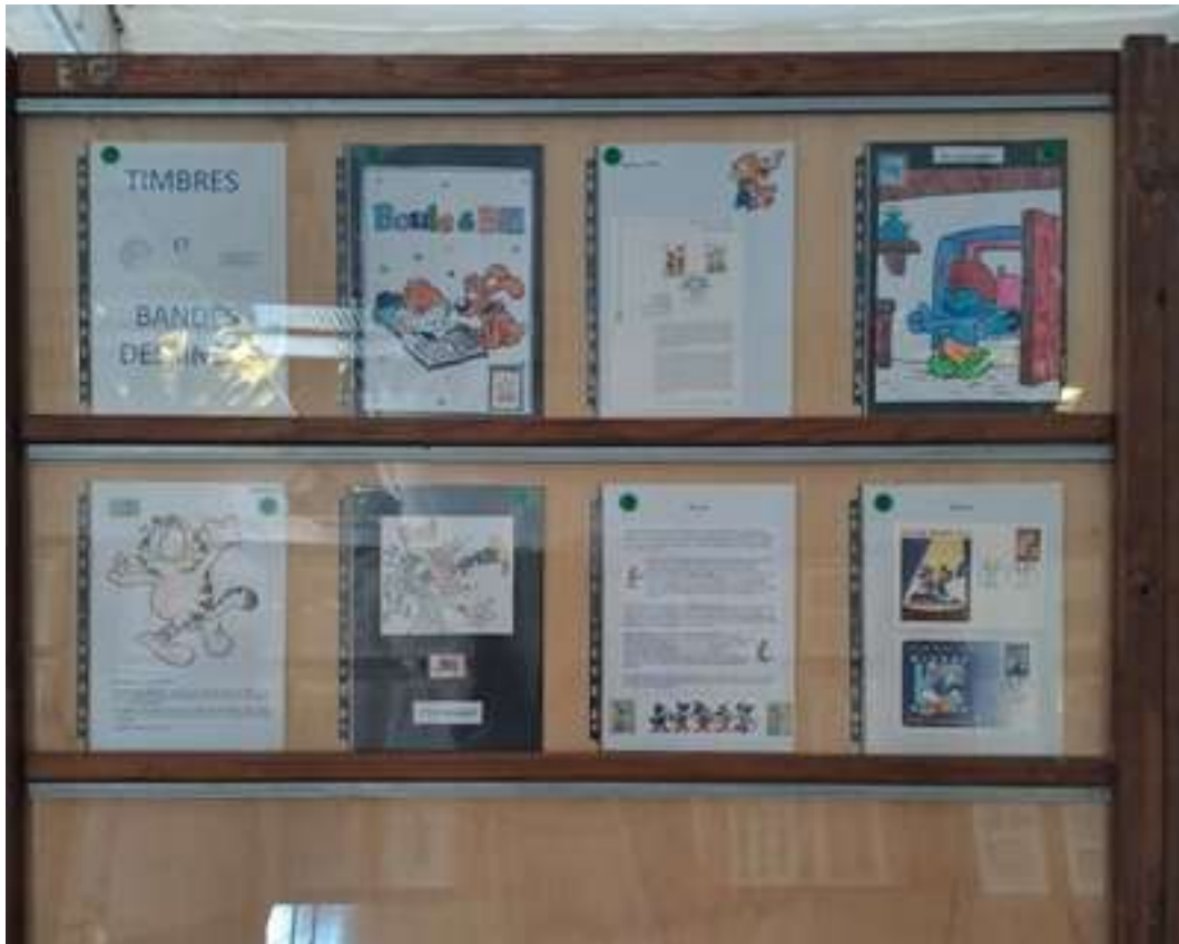
Les deux cadres présentés lors du championnat en classe « Jeunes »