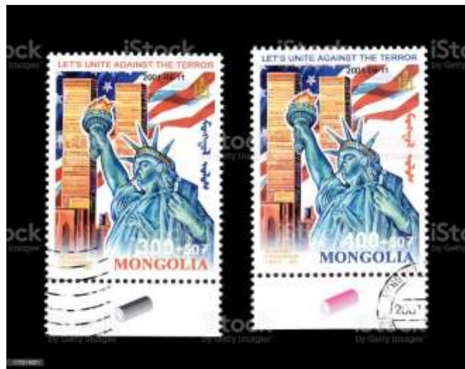
Monolie : commémoratifs du 11 septembre 2001

Le 11 septembre 2001, le monde entier assiste, effaré, au long déroulé d'un événement en apparence impossible : des attaques aériennes coordonnées contre les tours jumelles du World Trade Center à New York et contre le Pentagone à Washington. Près de 3 000 personnes perdent la vie, ce qui en fait l'attaque terroriste la plus meurtrière de l'histoire.