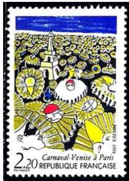
France, Yvert 2895

Au sortir de la Haute Vallée de l'Aude, se perpétue depuis 400 ans le « carnaval le plus long au monde » : le Carnaval de Limoux.