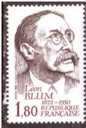
Le timbre : Yvert numéro 2251,

Léon Blum est né à Paris en 1872, dans une famille israélite. Il fit de brillantes études, suivant les cours du Lycée Condorcet puis de l'Ecole Normale Supérieure.