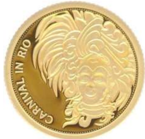
5 dollars de Samoa, monnaies officielles