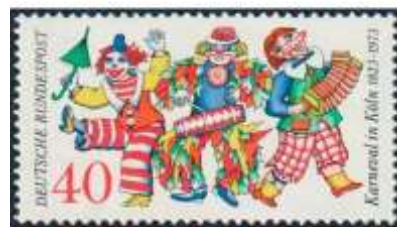
R.F.A., timbre de 1973