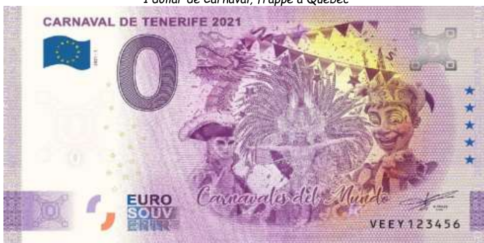
Billet souvenir touristique du Carnaval de Tenérife