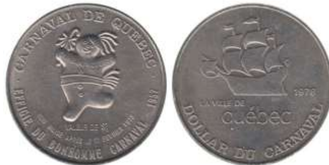
1 dollar de Carnaval, frappé à Québec