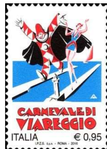
Italie, émis en 2016