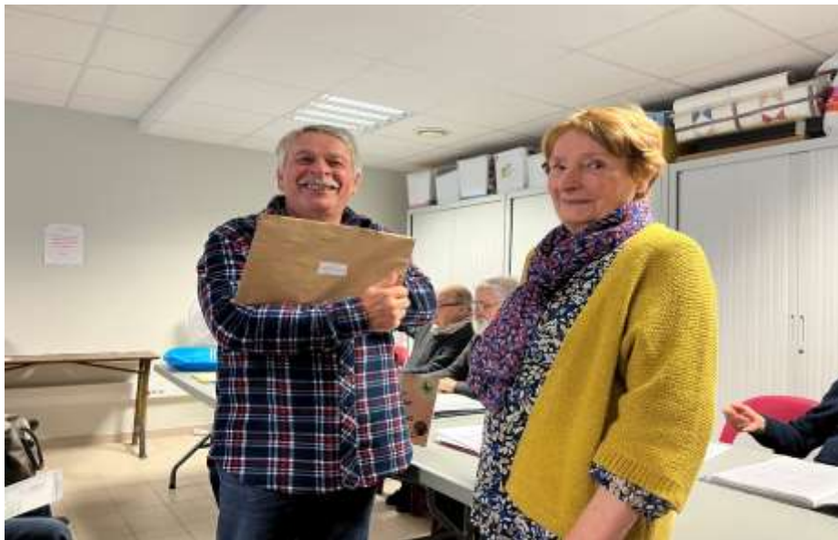
Lors du tirage de la tombola