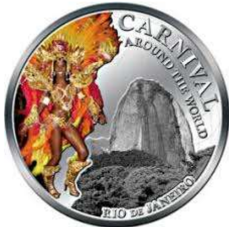
1 dollar des Iles Fidji

fête, en reprenant la danse utilisée dans l'effort et la transformer en joie, en bonheur ? », pouvait-on lire début janvier dans la presse locale.