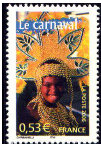
France, Yvert 3887

De janvier à mars, tous les samedis et dimanches et le mardi gras, les « Fecos » et « Goudils » (personnes masquées), accompagnés par la musique traditionnelle, dansent d'un café à l'autre entre les arcades médiévales de la place de la République dans un grand tourbillon de fête et de musiques typiquement limouxines. Folklore à l'état pur, le spectateur est ici un élément actif de la comédie improvisée. En effet, pas de cortège dans ce carnaval, mais une vaste comédie codée aux règles transmises de génération en génération.