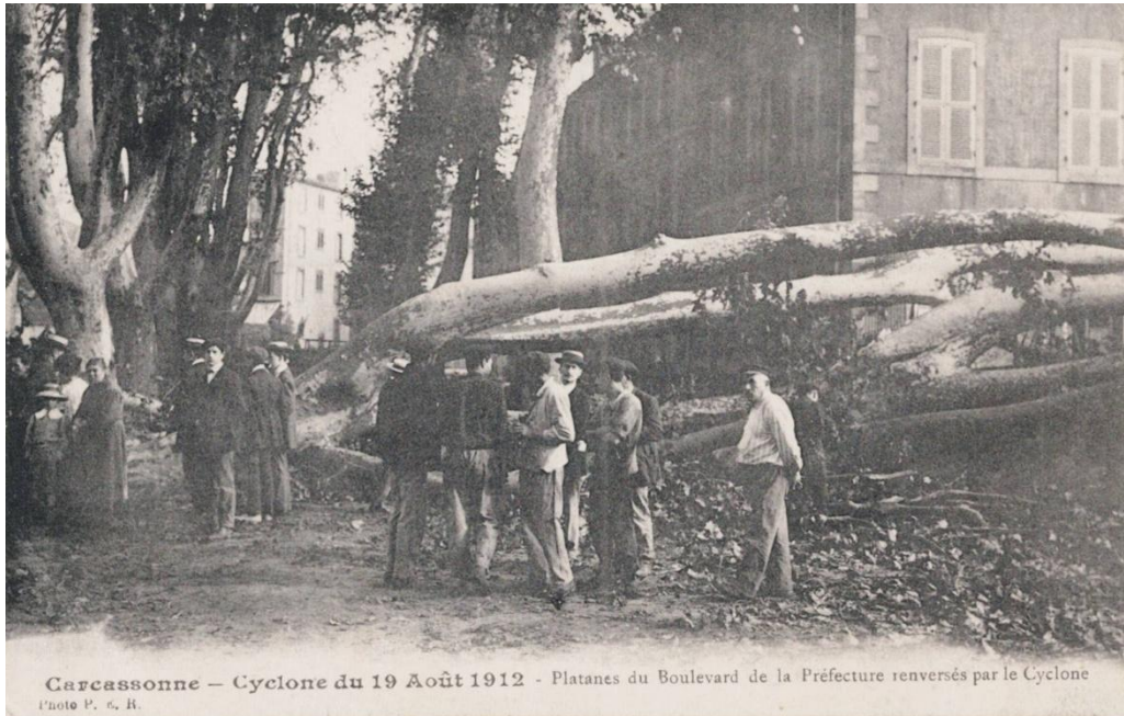
Boulevard de la préfecture après le cyclone.

Et d'un seul coup, c'est l'enfer. Le Cers, venant de l'ouest, va soudainement souffler avec une rare violence, accompagnée d'énormes grêlons et d'un orage d'une rare intensité. Les passants qui rentrent chez eux en cette fin de journée ont à peine le temps de se réfugier sous le porche le plus proche avant que le cyclone ne fasse son œuvre.