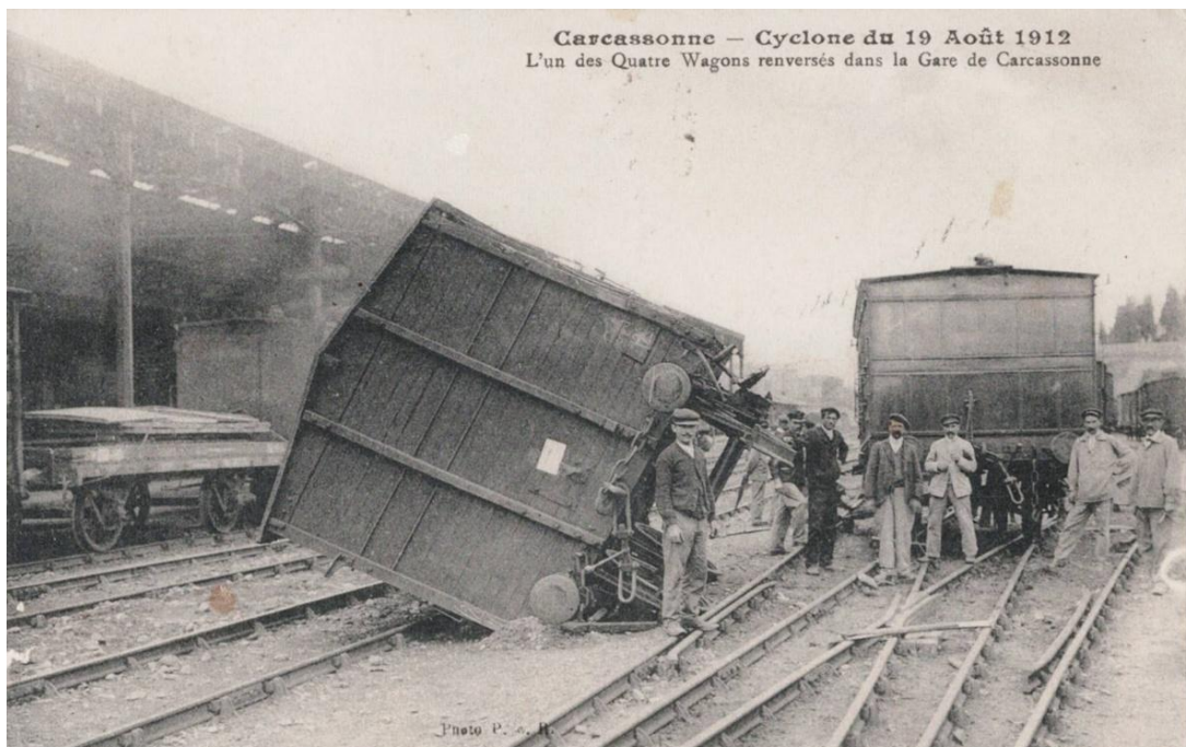
L'un des 4 wagons renversés dans la gare de Carcassonne.

Après une vague de chaleur exceptionnelle en mai avec des températures dépassant les 33°, l'été va être l'un des plus frais depuis 70 ans. Le manque de maturité du raisin commence à en inquiéter certains, l'économie locale dépendant essentiellement de la culture de la vigne et de la qualité de la récolte. On est loin de penser à ce moment-là que les vendages seront terminées dans une heure sur un rayon de 10 km, les éléments climatiques l'ayant décidé contre toute attente.