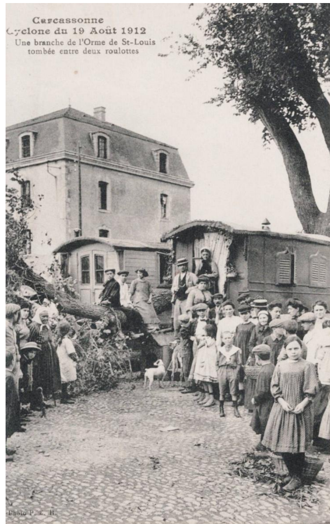
Une branche de l'orme de celle Louis, tombée entre 2 roulottes.