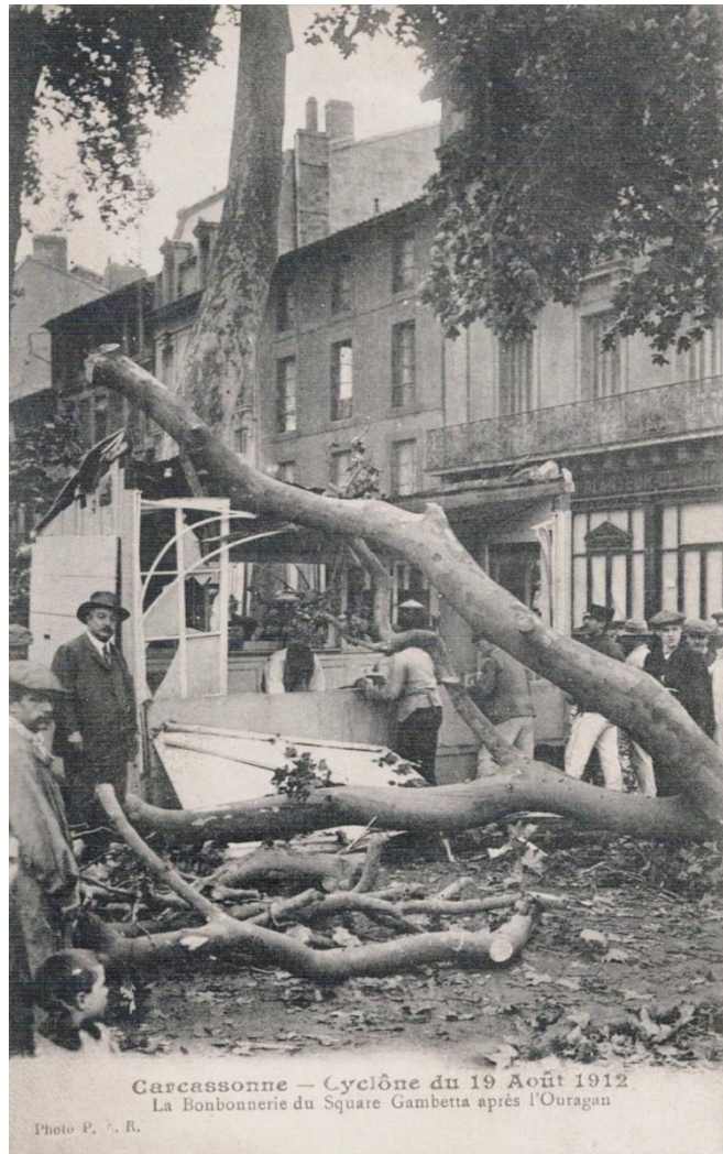
La bonbonnerie du Square Gambetta après l'ouragan, avec un homme au chapeau melon à gauche.

La période 1905 1920 étant celle du plein essor de la carte postale, un éditeur local, va parcourir la ville et prendre une dizaine de clichés qui vont être les témoins de ces événements dramatiques.