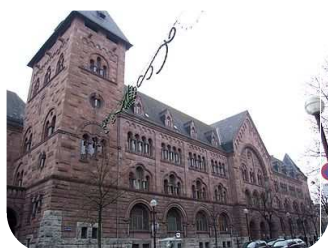
La Poste : L'imposante façade de style néoroman.

Moderne et imposant, le centre des congrès de Metz accueillait le Championnat de France toutes catégories avec 16 classes d'exposition et 234 collections représentées.