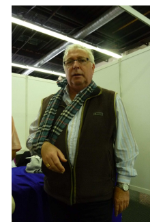
Ici saint Roger d'Issel qui clôture le 84 e congrès.

Face aux nombreuses réclamations des associations sur les modifications du sujet de la Fête du Timbre, La Poste revient sur ses décisions. En 2012 le sujet annoncé est « l'air » et pour 2013 « le feu ».