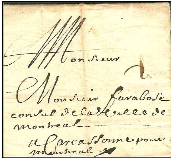
Figure 1 : Lettre de 1679 de Carcassonne adressée au Consul (Maire) de Montréal de l'Aude.

L'encre utilisée pour « Monsieur », l'adresse et la mention « a Carcassonne pour Montréal » est la même. C'est donc l'écriture de l'expéditeur et l'encre utilisée est noire.