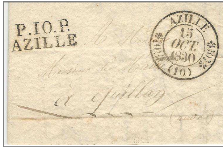
Lettre en port payé d'Azille avec le timbre à date à doubles fleurons au type 11.