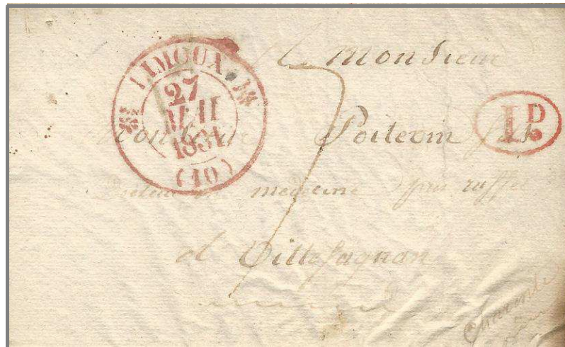
Lettre en port du de Limoux avec le timbre à date à simples fleurons au type 12 frappé en rouge.