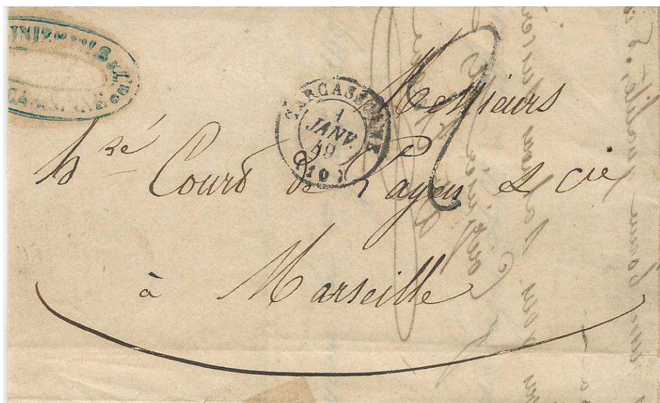
Lettre du 1er janvier 1849 avec la marque "2" au tampon.

Dès le 1er janvier, les postiers vont avoir en leur possession une marque "2" qui correspond à la nouvelle marque territoriale et qui rappelle la marque à la plume utilisée précédemment par les postiers pour préciser la taxe à faire payer à l'arrivée par le destinataire.