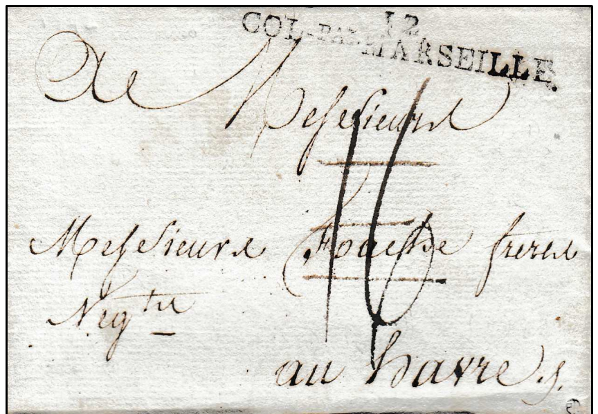
30 septembre 1792 : lettre de Leogane à Haïti pour Le Havre