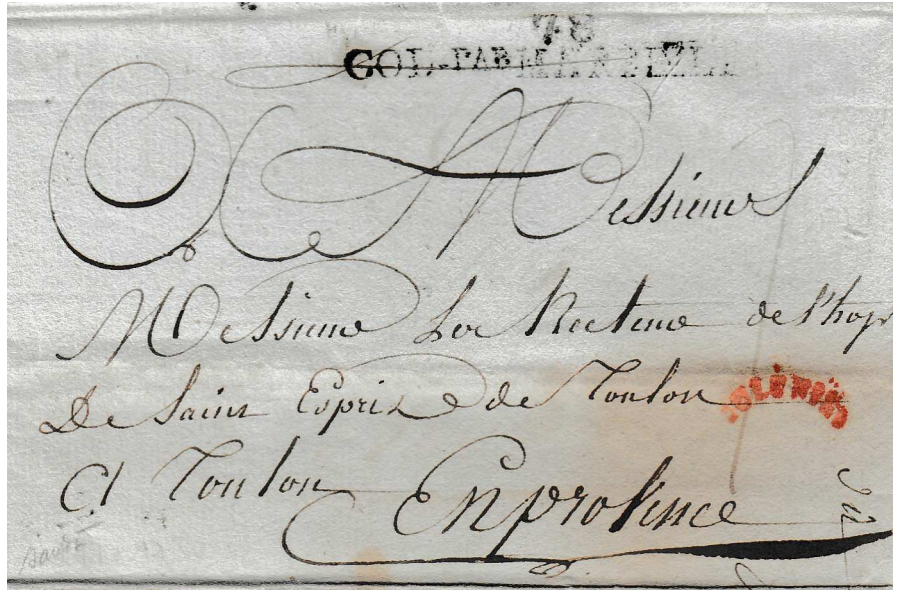
2 janvier 1792 : lettre de St Domingue pour Toulon

78 étant alors le n° du département du Var