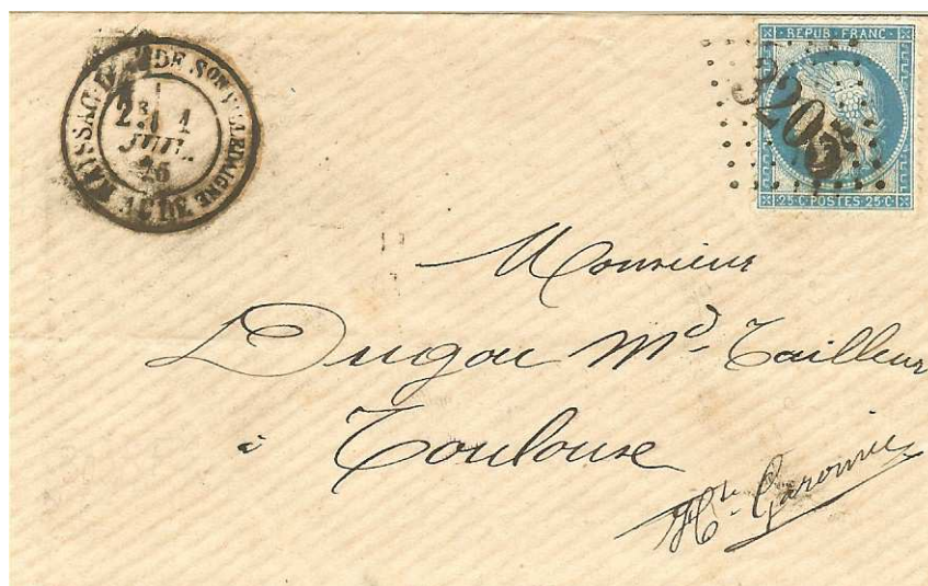
Lettre de Raissac d'Aude - Section de Villedaigne avec le "gros chiffres" n° 3205 utilisé en 1875 après la fin de la guerre. Tarif à 25 c. du 1er septembre 1871 pour une lettre jusqu'à 20 g. de bureau à bureau.