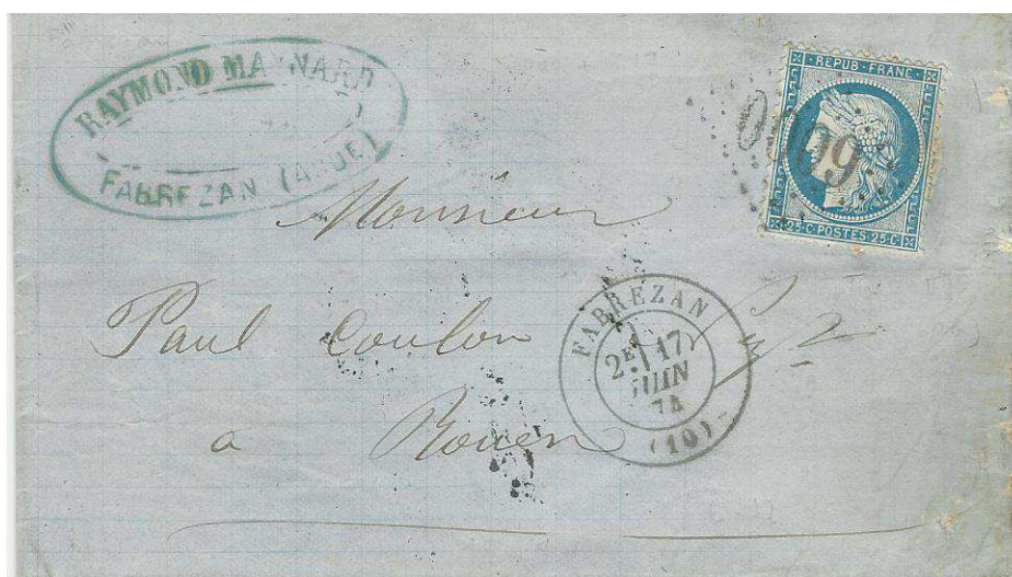
Lettre de Fabrezan avec le losange "gros chiffres" n° 6000.

Cette nouvelle marque doit être apposée réglementairement à l'encre noire. Elle ne sera utilisée bien entendu que sur les lettres préalablement affranchies avec des timbres-poste.