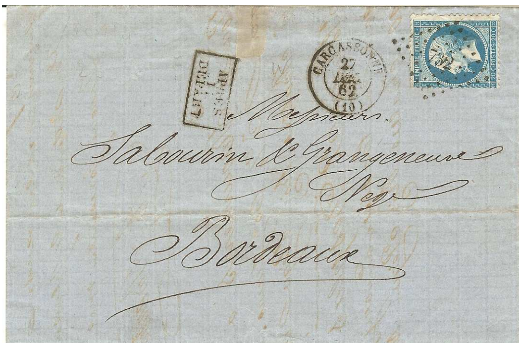
.27 décembre 1862. Utilisation précoce du losange "petit chiffre du gros chiffre" n° 732 par le bureau de Direction de Carcassonne sur lettre pour Bordeaux affranchie avec un 25 c. Empire .

C'est bien entendu l'arrivée du losange "petit chiffre du gros chiffre" et du Bulletin Officiel de La Poste au bureau de Direction qui fait que celui-ci peut avoir utilisé ce procédé d'annulation du timbre avant le 1er janvier 1863. C'est le cas du bureau de Carcassonne.