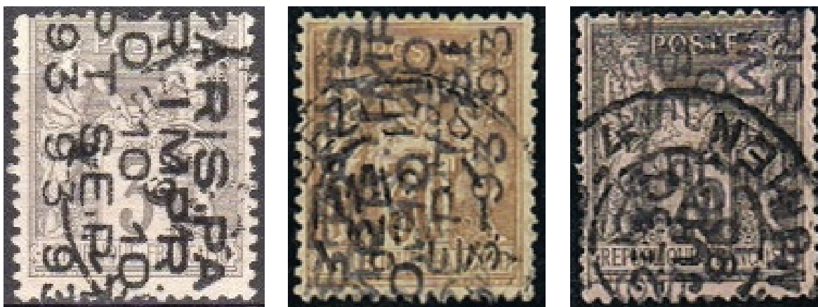
Quelques préoblitérés avec fausses surcharges... apposées par-dessus l'oblitération.

En conséquence, si vous voyez proposés à la vente (et le cas se présente souvent) des préoblitérés classiques ou de 1920-22 avec oblitération, fuyez sans vous retourner ! Il s'agit presque à coup sûr de la production d'un faussaire « à la petite semaine » ayant trouvé plus rentable d'effectuer des fausses surcharges sur des types Sage ou des Se-meuse oblitérés (puisqu'il s'en trouve des cargaisons sur le marché), que sur des timbres neufs (un peu moins fréquents et plus onéreux).