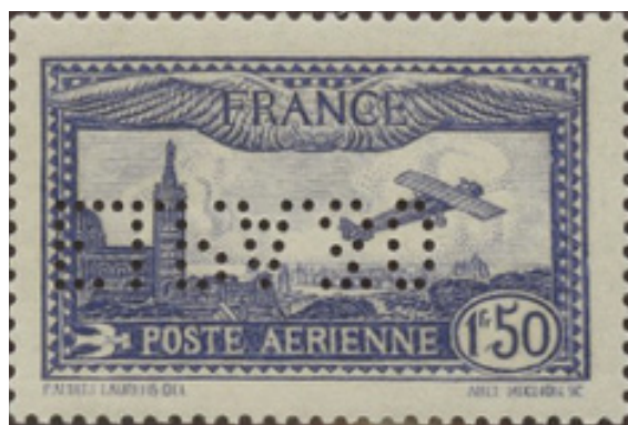
A gauche : fausse perforation EIPA sur Poste aérienne 1F50 bleu. A droite : perforation authentique sur Poste aérienne 1F50 outremer (à noter : les perforations peuvent se trouver indifféremment dans le bon sens ou renversées).