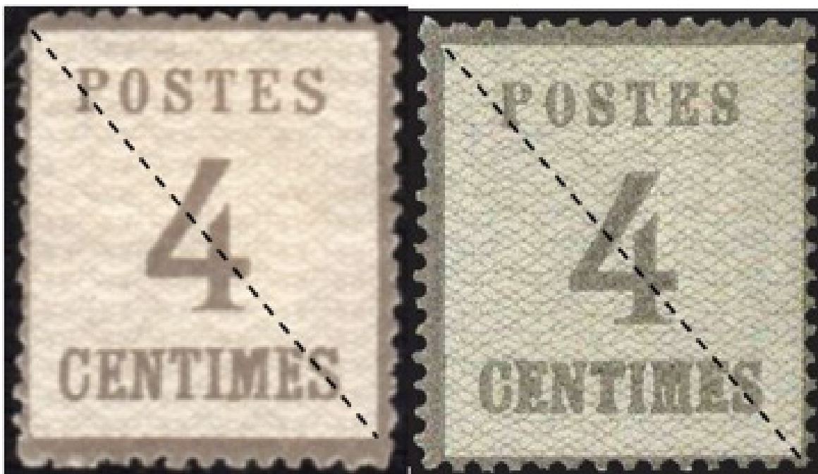
A gauche, le faux de Hambourg. A droite, le timbre authentique.

Malheureusement, en 1885, un négociant de Hambourg s'avise de faire imprimer des copies de ces timbres. Même si le catalogue Maury désigne cette production sous le terme « réimpression », il s'agit en réalité de faux, dans la mesure où, à l'exception de la planche du burelage, le matériel utilisé n'est pas celui d'origine : il a en effet