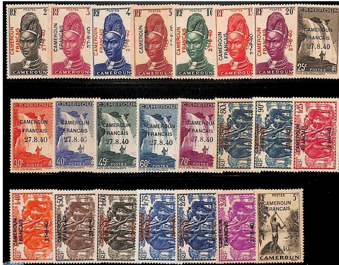
Cameroun : timbres avec la surcharge "Cameroun français 27.8.40"

Ces initiatives remplissent un double rôle. D'une part, elles affichent le ralliement des territoires à la France Libre , affirmant au monde que cette dernière continue de combattre et contrôle d'importantes régions en Afrique, en Amérique et en Océanie. D'autre part, elles servent un but financier : une partie des timbres surchargés est envoyée vers les pays alliés. pour être vendue aux collectionneurs. Même en pleine guerre, un marché existe en effet pour ces timbres à Londres et à New York, où se trouve un comptoir spécialisé, la « F-L Stamp Company ». La vente de timbres-poste constitue