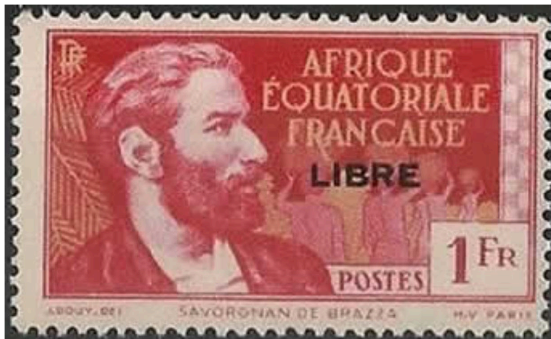
Afrique équatoriale française : timbre avec la surcharge "Libre" de 1940.

Dans ce contexte, la philatélie joue un rôle crucial. Dans chaque colonie qui se rallie à la France libre, des ordres sont donnés pour surcharger les timbres avec la mention « FRANCE LIBRE » . L'Afrique équatoriale française (AEF) ouvre la voie : un arrêté du gouverneur général, daté du 12 septembre 1940, stipule que les timbres-poste de l'AEF porteront, en surcharge, le mot « LIBRE » après « Afrique équatoriale française ». C'est ensuite le tour du Cameroun où le général Leclerc ordonne de surcharger les timbres « Cameroun français » et « 27-8-40 », date de la prise de contrôle par les Français libres.