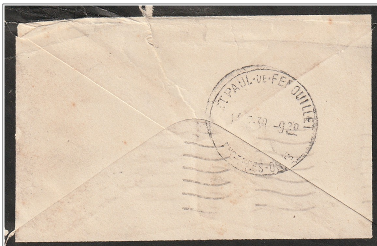
Timbre à date d'arrivée type A5 St Paul de Fenouillet du 17 juillet 1938.

Les accords de MATIGNON du 8 juin 1936 signés entre le gouvernement, le patronnat et les syndicats instaurent la semaine des 40 heures, les congés payés (15 jours), la liberté syndicale et la négociation collective.