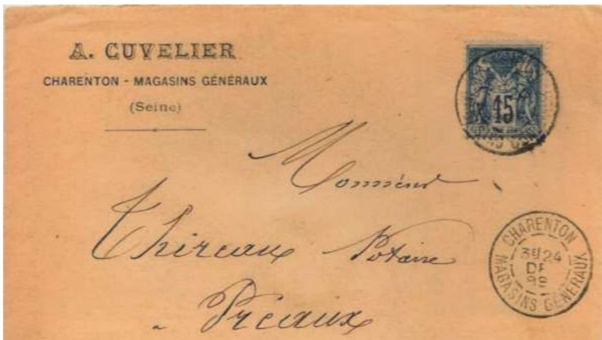
Cachet à date Charenton / magasins généraux.

Le plus connu, notamment des collectionneurs du type Sage, est le bureau annexe du casino de Boulogne (Pas de Calais), qui n'a été ouvert que pendant l'été 1884. Seuls quelques BIP sont connus pendant la période du type Sage.