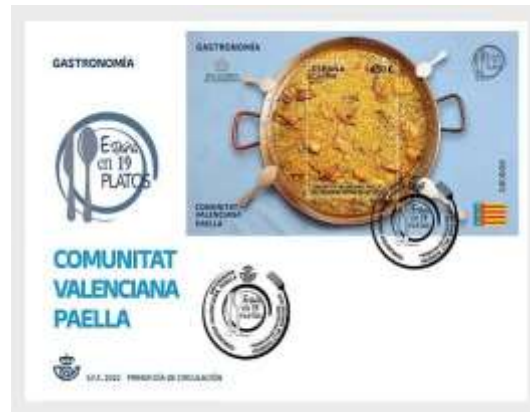
Bloc-feuillet espagnol (bloc-feuillet de 2022)

La paëlla se préparait au feu de bois et pour relever la bonne odeur du plat. La paëlla aux fruits de mer est une des variétés les plus appréciées même jusqu'à ce jour