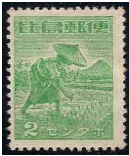
La riziculture (Oc. Japonaise Philippines 1941)