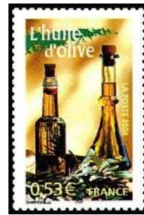
L'huile d'olive (France 2004)

Pour les adeptes de fruits de mer, ils peuvent faire le choix entre les homards, les écrevisses, les crevettes, les calmars ou encore le crabe.