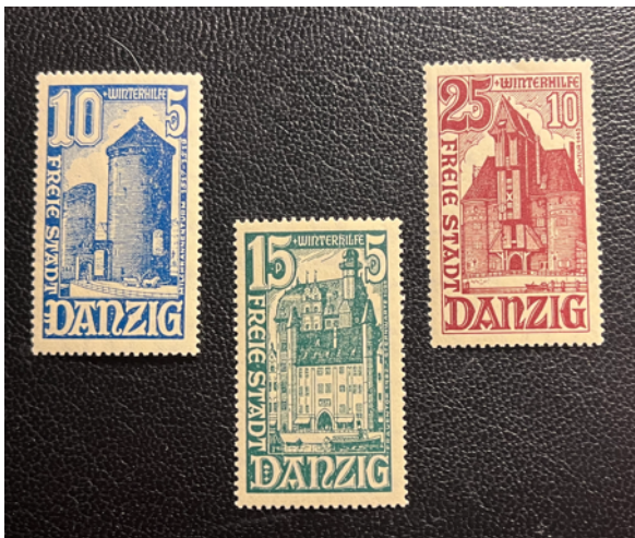
Figure 12 – Timbres du secours d'hiver 1936

l'émission de 1936) . D'autres timbres de poste aérienne, de service ou de taxe paraîtront aussi.