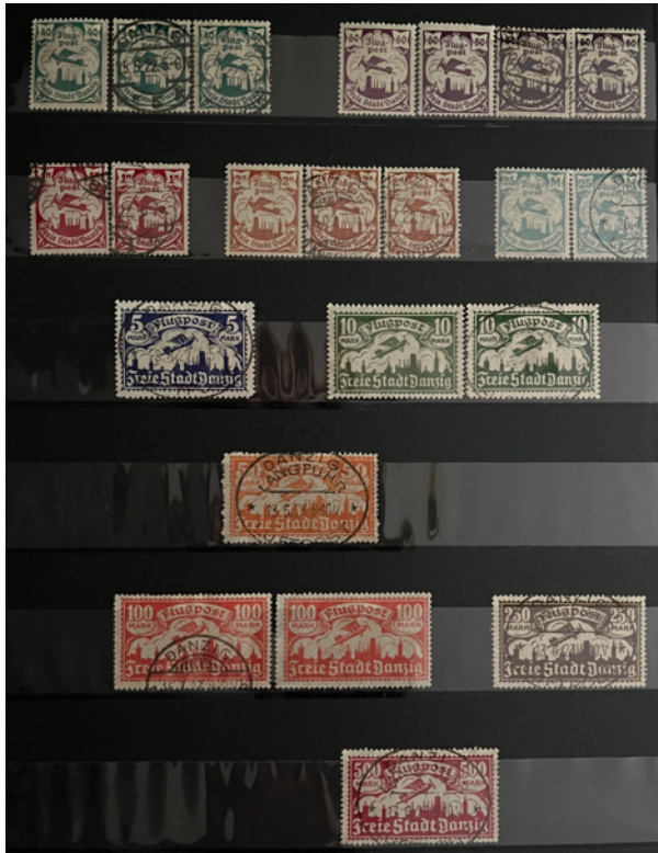
Figure 7 – Poste aérienne 1921-23