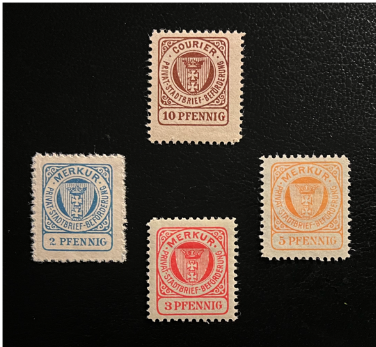
Figure 4 - Timbre de 10 Pf (1897) avec inscription « COURRIER » et timbres Mi 4,5 & 6 avec « MERKUR »