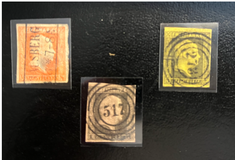
Figure 1 -Prusse Mi 1, 2 et 3 (1850-56) 2

Le premier timbre à l'effigie du roi Frédéric-Guillaume IV est émis en 1850 (fig. 1) ; sur la période de 17 ans qui suit 25 autres timbres portant aussi soit les armes du royaume soit de simples chiffres viendront. Un nombre conséquent d'entiers postaux reprenant les mêmes motifs seront aussi utilisés.