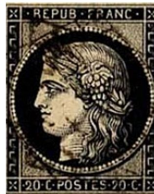
Premier timbre français émis. Cérés 20 c mis en vente le 1 er janvier 1849, gravé par Jacques-Jean Barre. N° 3 Y et T