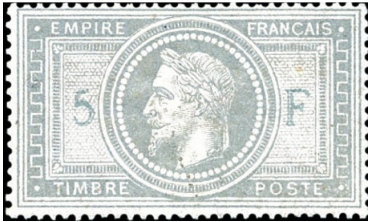
5 F empire lauré dessiné et gravé par Désiré-Albert Barre n° 33 Y et T