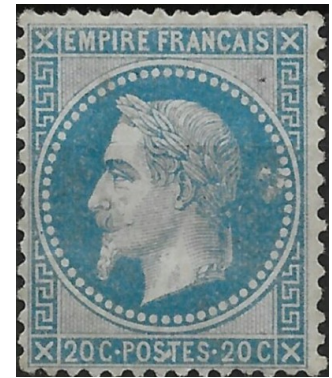
20 cempire Lauré gravé par Désiré-Albert Barre n° 29 B Y et T