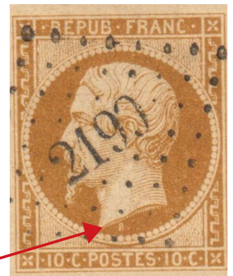
Timbre Présidence gravé par Jacques-Jean Barre. Sous le cou du Prince Président le B de Barre. N° 9 Y et T